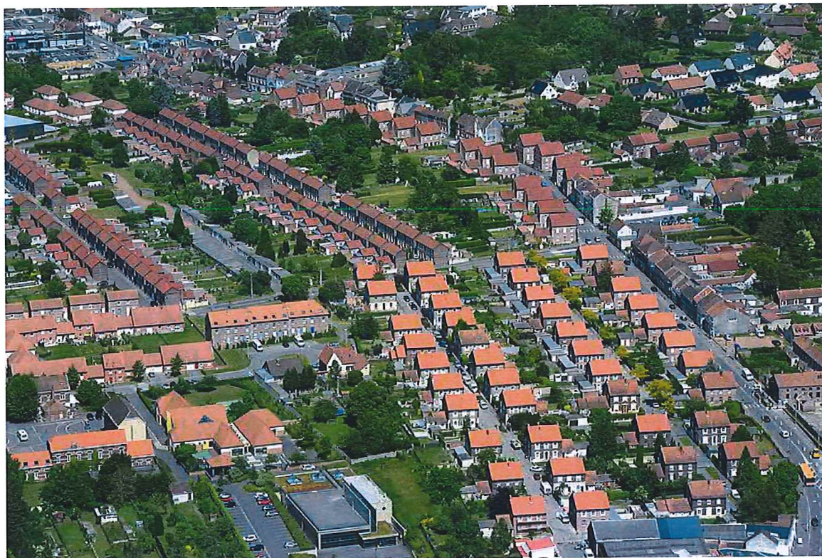
Bruay-la-Buissière (Pas-de-Calais)

L'écoconstruction et la rénovation énergétique des bâtiments pourront notamment s'appuyer sur des filières agricoles innovantes fondées sur les biomatériaux, développées dans le cadre de la valorisation des terres agricoles polluées.