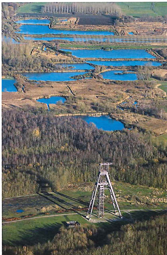
Chevalement Chabaud-Latour, Condé-sur-l'Escaut (Nord)

Les conséquences du déclin puis de l'arrêt de l'activité charbonnière se sont également fait sentir d'un point de vue démographique, avec un déclin dès les années 1960. Toutefois, sur les quinze dernières années, cette tendance au repli démographique s'infléchit. Ainsi, les communautés d'agglomération (CA) de Béthune-Bruay Artois Lys Romane., de Valenciennes Métropole et de La Porte du Hainaut enrayent la baisse et stabilisent leur population, tandis que celles de Lens-Liévin, d'Hénin-Carvin et du Douaisis continuent de connaître un léger recul annuel moyen de leur population. Le solde migratoire est négatif, compensé toutefois par un solde naturel positif sur les territoires qui stabilisent leur population.