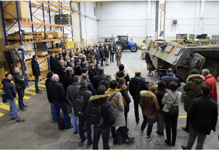
Visite des entreprises au détachement de la 12 e BSMAT de Douai en février 2020.

La déléguée à l'accompagnement régional des Hauts-de-France intervient sur des domaines variés du champ économique et dans la mise en œuvre de la politique ministérielle en faveur des PME (Plan Action PME). Elle assure la mission de point unique d'information du ministère des Armées, en lien avec le correspondant de la Direction générale de l'armement (DGA) en région et à destination des entreprises régionales.