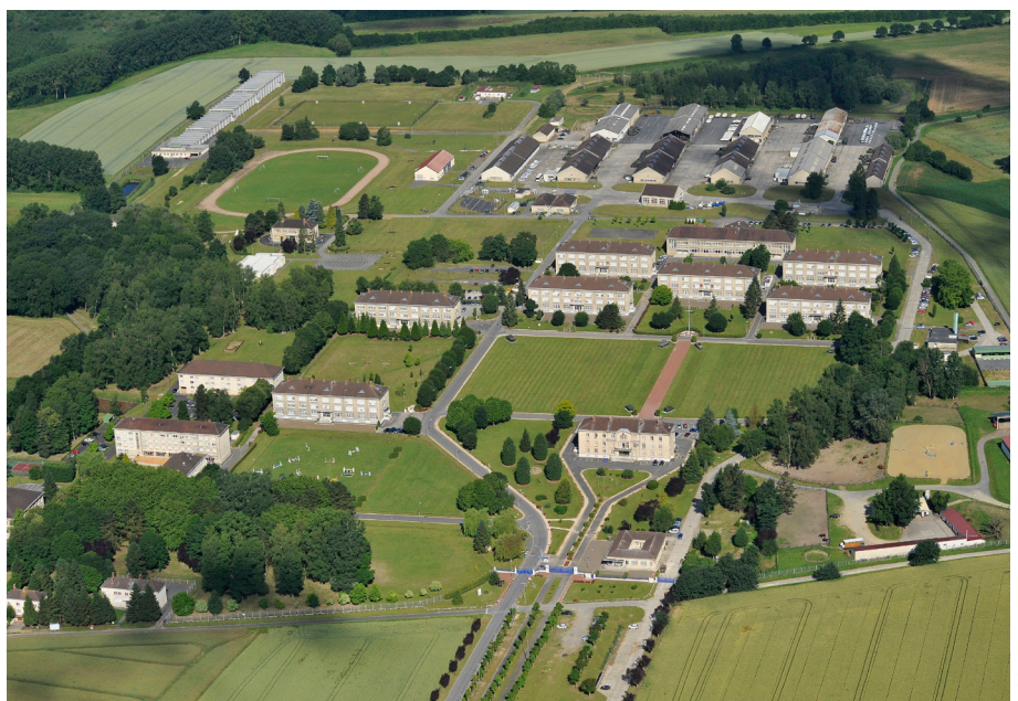
Vue aérienne du quartier Berniquet de Noyon.

Le quartier Berniquet, site de 47 hectares portant 30 bâtiments, a été reconverti à la suite du transfert du régiment de marche du Tchad de Noyon en campus économique « Inovia » dédié aux start-up et entreprises innovantes. Cet écosystème offre ainsi des solutions d'accueil à une cinquantaine d'entreprises générant plus de 250 emplois. Un internat de la réussite (Éducation nationale) y est installé depuis 2010 pour les élèves de la 6 e à la terminale ainsi que des classes préparatoires commerciales. Le site a également été retenu pour accueillir à compter de 2021 des personnels de la Direction générale des finances publiques. Le montant total du contrat s'est élevé à 36,7 M€ dont 10 M€ de crédits État.